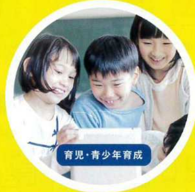
育児・青少年育成