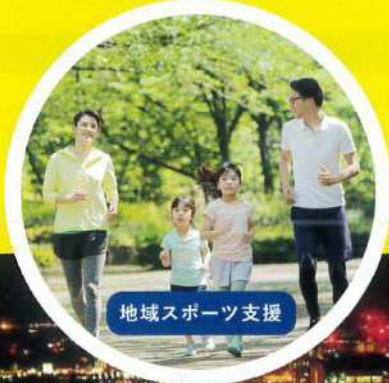
地域スポーツ支援