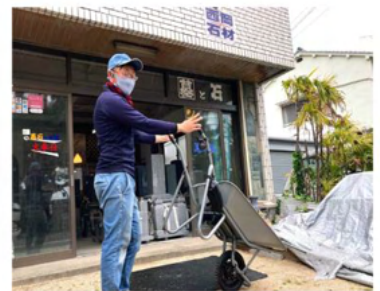
暮石や砂利の運搬