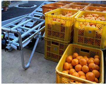
みかん農家様の運搬