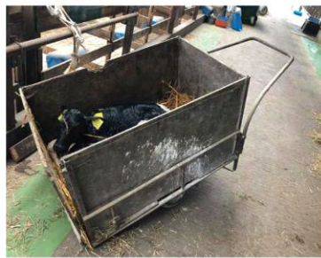
牧場で子牛の運搬